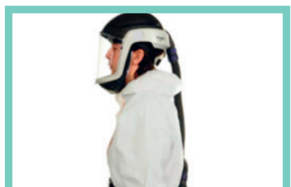
Airstream-helm met motor aangedreven P3 gefilterde lucht

Kans op lekkage langs masker. Fittesten noodzakelijk.