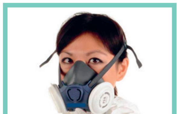
Half gelaatmasker met P3 filter

Kans op lekkage langs masker. Fittesten noodzakelijk.