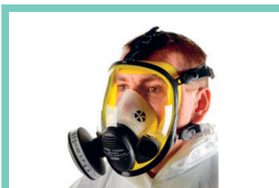
Volgelaatmasker met P3- filter

Kans op lekkage langs masker. Fittesten noodzakelijk.